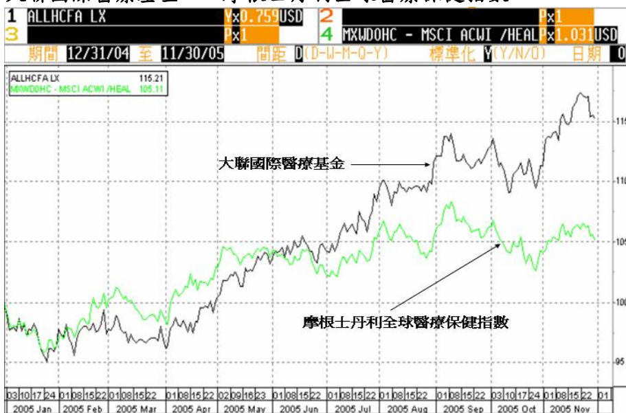
資料來源: Bloomberg (原幣計算，截至 11/30/2005)